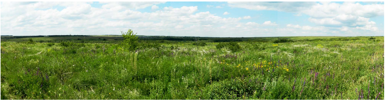
Рис. 1. Характерный ландшафт заповедника «Хомутовская степь».

и река превращается в цепь полуизолированных бассейнов (рис. 2В, 2Г). Вода из нее используется для водоснабжения прилегающих населенных пунктов и предприятий, а также для оросительных работ в сельском хозяйстве. Изолированность бассейна реки для многих групп водных беспозвоночных делает ее чрезвычайно чувствительной к любым антропогенным воздействиям, в связи с чем изучение ее современного видового состава представляет особый интерес.